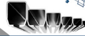
Emne vægt 1.500 kg